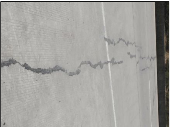
桥面连续位置开裂