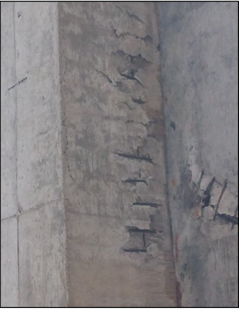
1#墩右侧盖梁侧面露筋