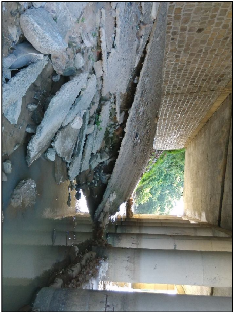
惠来岸左侧护坡破损